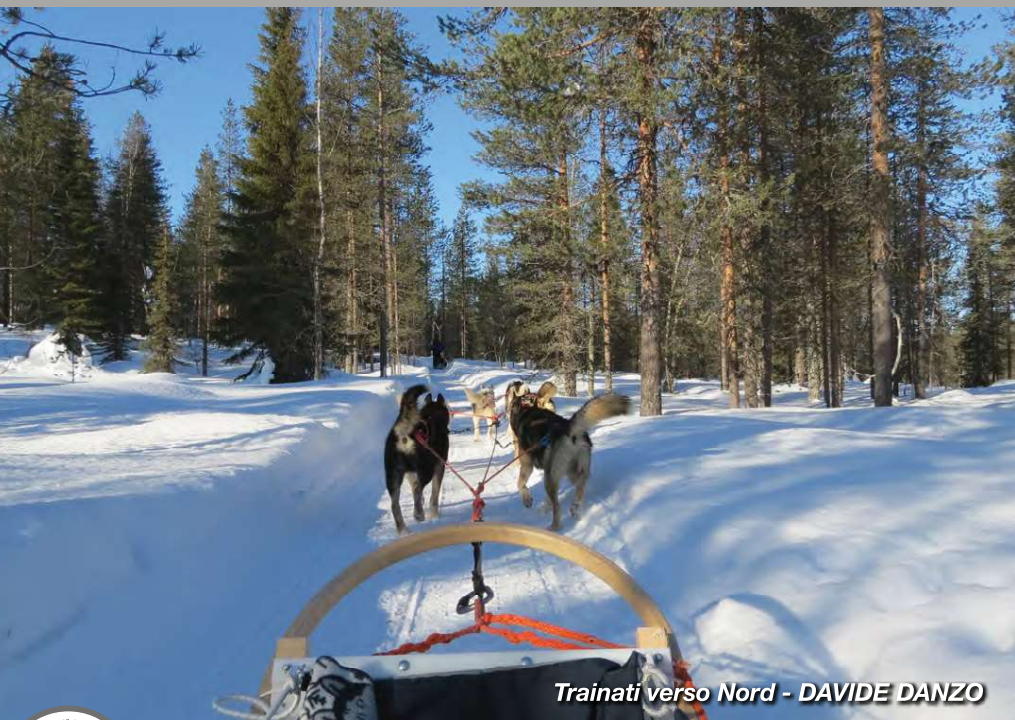
Trainati verso Nord - DAVIDE DANZO