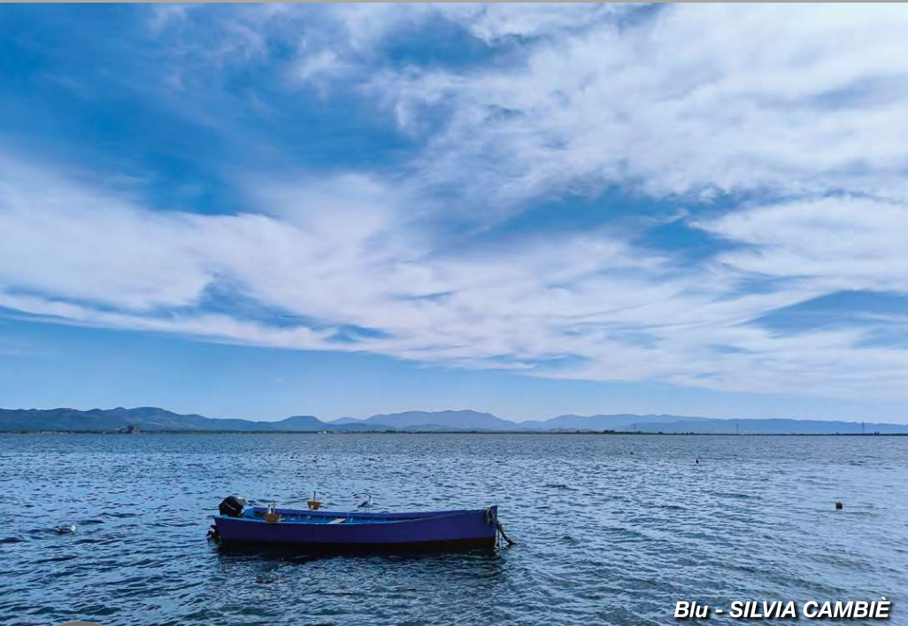
Blu - SILVIA CAMBIÉ