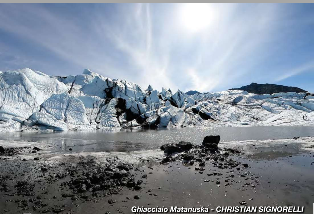
Ghiacciaio Matanuska - CHRISTIAN SIGNORELLI