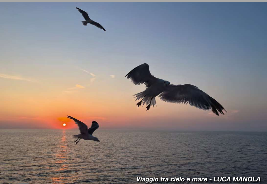
Viaggio tra cielo e mare - LUCA MANOLA