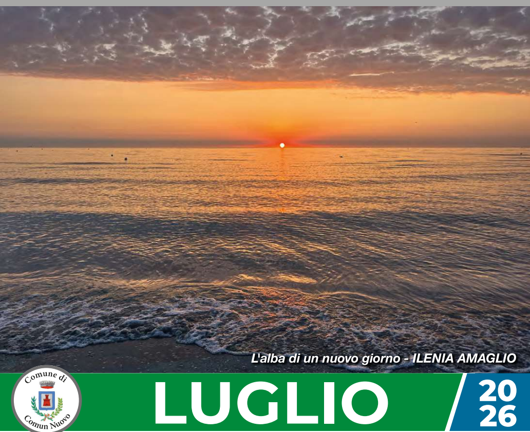
L'alba di un nuovo giorno - ILENIA AMAGLIO