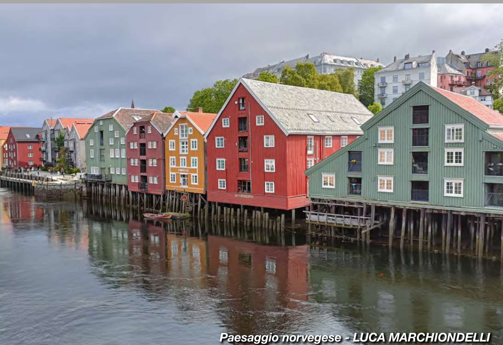
Paesaggio norvegese - LUCA MARCHIONDELLI